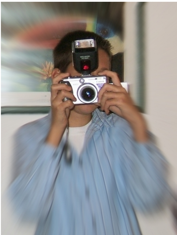
Zoomeffekt mit Objekt 2-Überlagerung