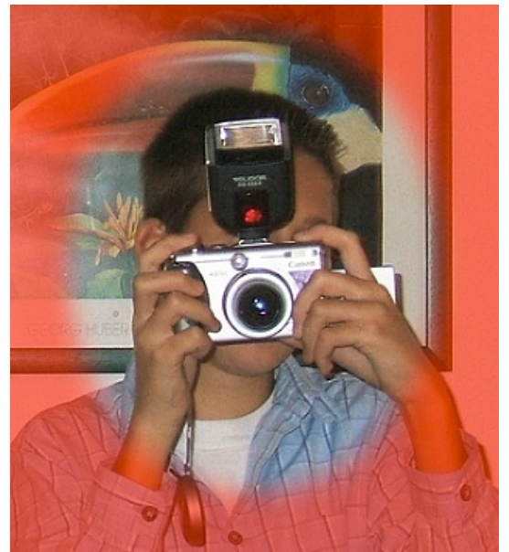
Maskenauswahl rot gesperrt